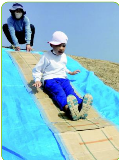
■生活単元学習（小学部）

※平成29年度から知的障がいの程度が軽度の生徒を対象とした高等特別支援学校を設置しました。（「4 高等特別支援学校とは」）