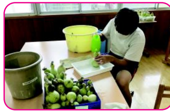
■生活単元学習 (中学校特別支援学級)