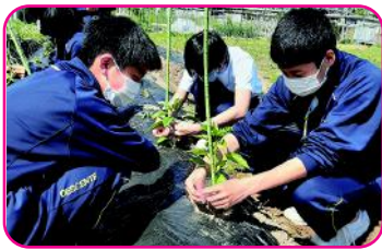
■生活単元学習 (中学校特別支援学級)