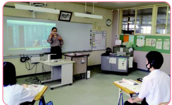
■特別の教科 道徳（中学部）

聴覚障がい者を対象とする特別支援学校では、聴覚に障がいのある幼児児童生徒を対象にして、早い時期から補聴器を使って「音」の存在に気付いたり、「ことば」の力を付けたりするための、きめ細かな指導や自立に向けての専門的な教育を行っています。